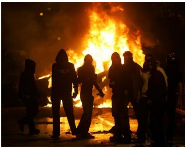
Στη φωτογραφία, μέλη της ΚΙΣΑ διαμαρτύρονται για τις ναζιστικές εκδηλώσεις ενάντια στην κατοχή

Το μίσος επικεντρωνόταν ιδιαίτερα σε όσους και όσες το 2004 τάχθηκαν και δημόσια υποστήριξαν το «Ναι» στο γνωστό δημοψήφισμα υπέρ ή κατά του σχεδίου Ανάν, τους Τούρκους, τους Άγγλους, τους πρόσφυγες, τους μουσουλμάνους και τις οργανώσεις ανθρωπίνων δικαιωμάτων που διαφωνούσαν με τις απόψεις και δράση τους.