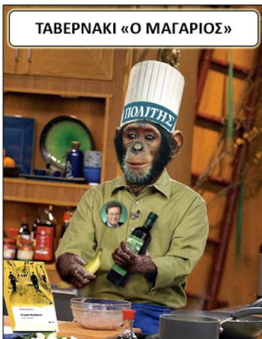
Η φωτογραφία είναι από το συγκεκριμένο άρθρο της ιστοσελίδας Christofias-Watch