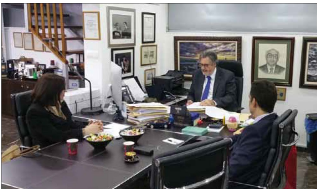
Ο κ. Χρ. Κληρίδης στη συνέντευξη που παραχώρησε στους Α. Καρατζά και Μ. Τσικουρή.

Η ΚΙΣΑ, καθότι ήταν ένα θέμα που αφορούσε άμεσα την δράση της, θεώρησε καταδικαστέο το γεγονός ότι ο κ. Ξενοφώντος, ένας από τους εκπροσώπους της Κυπριακής Δημοκρατίας στο Διοικητικό Συμβούλιο του FRA, συμμετείχε, είτε ως διαχειριστής, είτε ως υποστηρικτής, είτε ως σχολιαστής, σε ένα ιστότοπο με τα χαρακτηριστικά που περιγράφονται πιο πάνω.